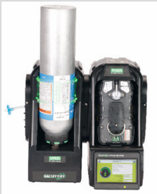
10128636 (Weitere Versionen erhältlich)